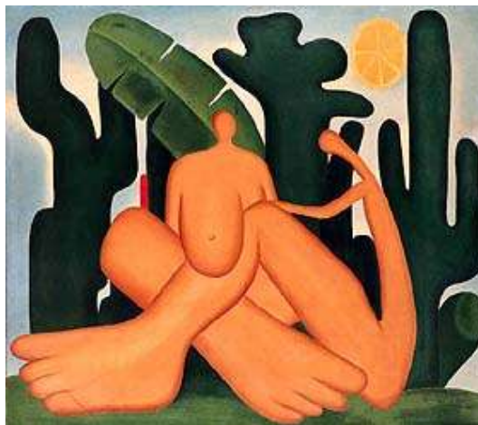
Nádia Gotlib – Tarsila do Amaral, a modernista – p. 143

Depois do grande escândalo no Brasil e do deboche dos franceses, sugerindo que o Abaporu procurasse um pedicure, o deslumbramento de Tarsila pelas coisas brasileiras continua no quadro Antropofagia , de 1929, onde a pintora une os quadros anteriores, A Negra e o Abaporu .